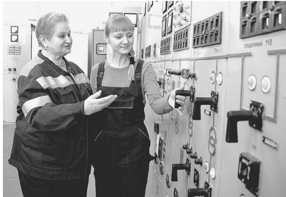
ВСЛЕД ЗА МАМОЙ. Главный щит управления в надёжных женских руках.