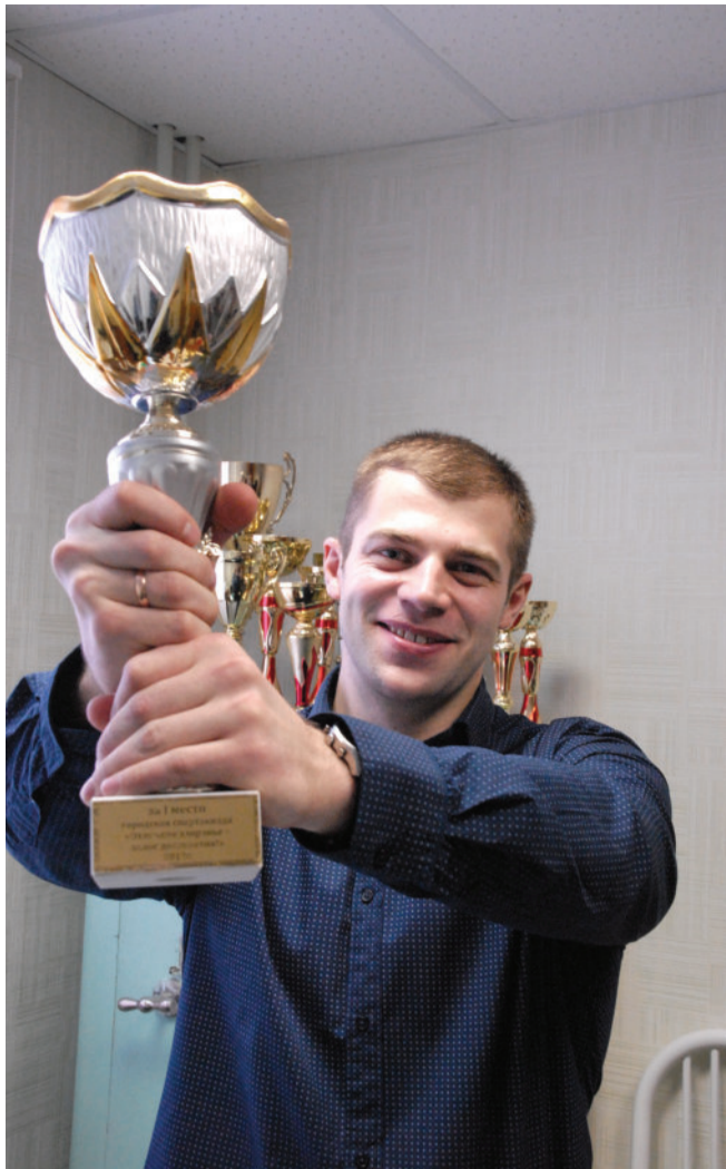
ЗА ПОБЕДУ! В 2013 году наш завод вновь стал победителем в спартакиаде среди промышленных предприятий города.

Старт эстафете Олимпийского огня был дан в России 7 октября. Из сердца страны — с Красной площади в Москве факел Олимпиады прошёл тысячи километров по многим городам и населённым пунктам России. Чести пронести символ Олимпиады в этот раз удостоились и наши зем-