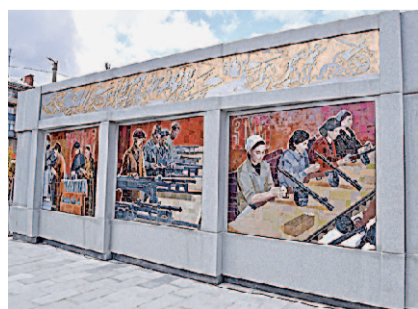
Левый пилон посвящен трудовому подвигу машиностроителей